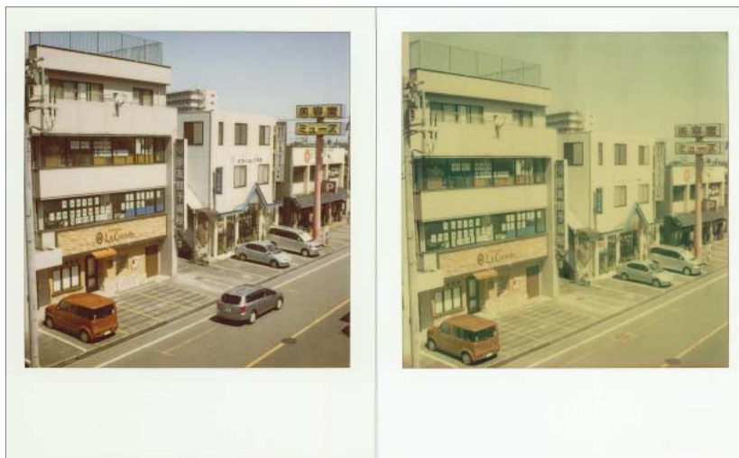
㊤T-600フィルム、㊦ArTistic TZフィルム

「ピールアパート（剥離式）のネガをモノシート・フィルムに転用するなど非常識！」が技術者の間では定説であったが、生産再開署名の数が増すごとに「どげんかせんといかん！」との思いが募り、ポラロイド社の倉庫に寝ていたネガの原反を一通り試してみ