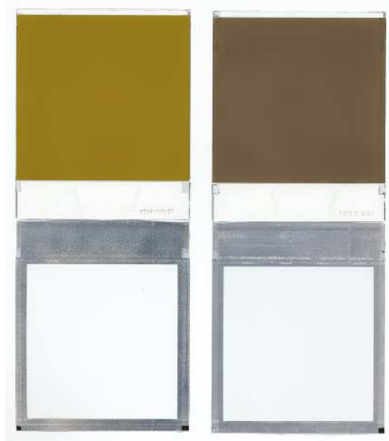
T-600フィルム(左)とArTistic TZフィルム(右)の展開図。600フィルムのネガは黄土色、ArTistic TZはPC-100のネガ(SX-70 TZフィルムのそれと色も構造もよく似ている)

イメージ・マニピュレーションとは撮影後のフィルムに竹や金属のヘラで写真面をこすり、画像をゆがませたり傷をつけたりすることにより、油絵のような作品に仕上げる手法。ArTistic TZの場合、撮影後1時間から24時間以内で作業をすることが望ましい。協力：Save Polaroid Japan